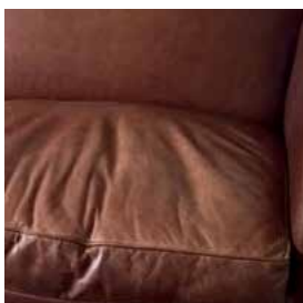
Normale plooivorming in leder/kunstleder na gebruik