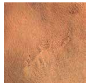
Littekens zijn een kenmerk van de echtheid van leder