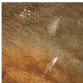
Kapotgaan van de oppervlakte door slecht onderhoud