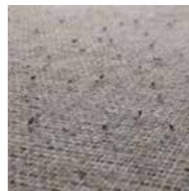
Pilling is een normaal verschijnsel en is eenvoudig te verwijderen