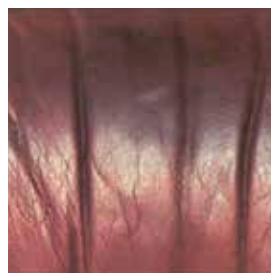
Slijtage door vetten van de hoofdhuid