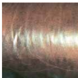
Slijtage door gebruik